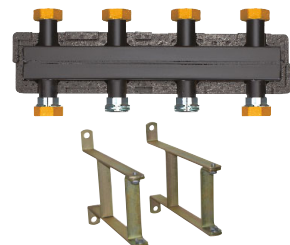
Obj. číslo MP66801.2 5 357,- Kč / 199,90 EUR

Ceny platí od 1. 4. 2024 do odvolání, minimálně do 31. 10. 2024.