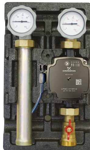
Obj. číslo M66811.36 8 870,- Kč / 331,00 EUR